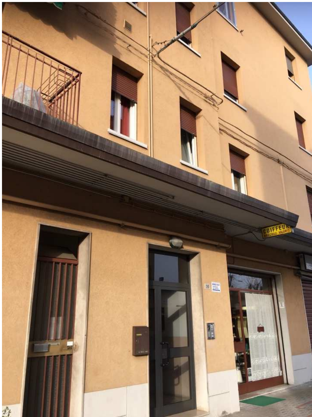
APPARTAMENTO SITO IN VIA CADRIANO N° 16/4 –Granarolo dell’Emilia (BO)