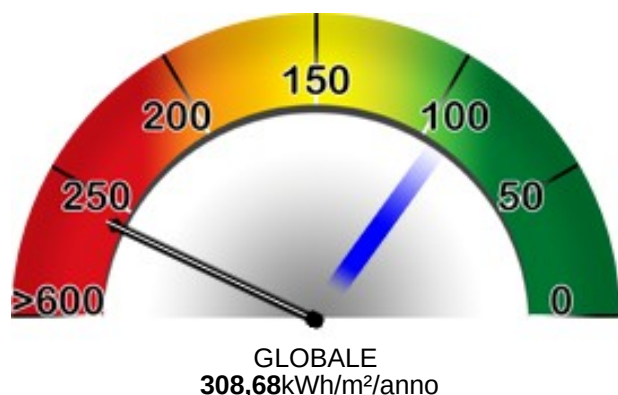
GRAFICO DELLE PRESTAZIONI ENERGETICHE GLOBALE E PARZIALI