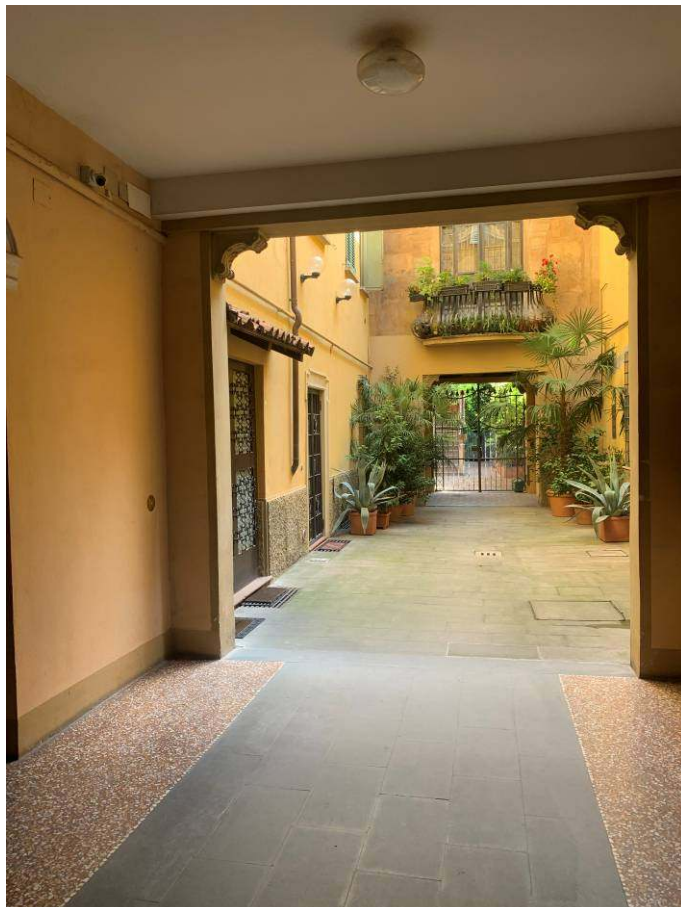
2. Corte di ingresso comune