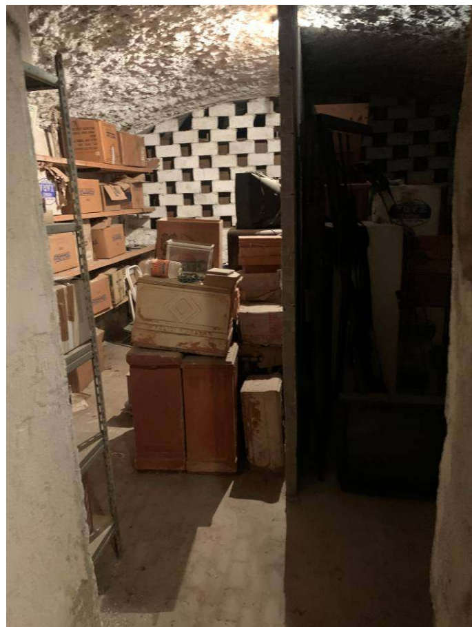
12. Piano interrato - cantina