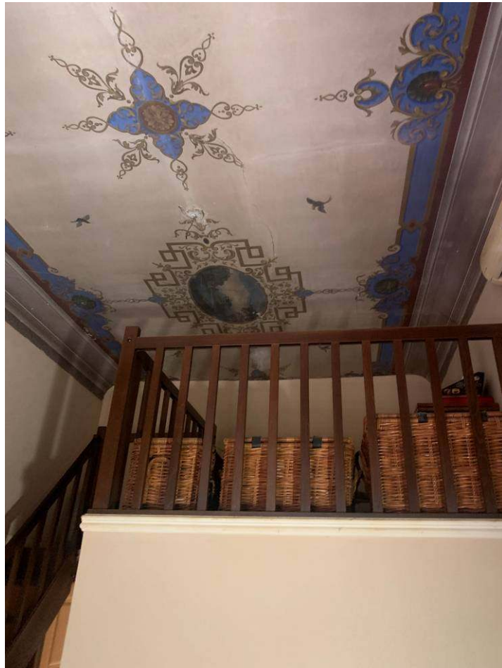
7. Soppalco camera