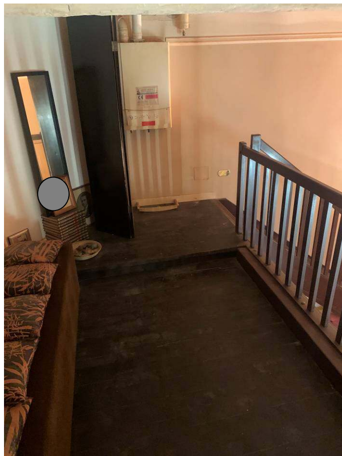
8. Soppalco sul soggiorno