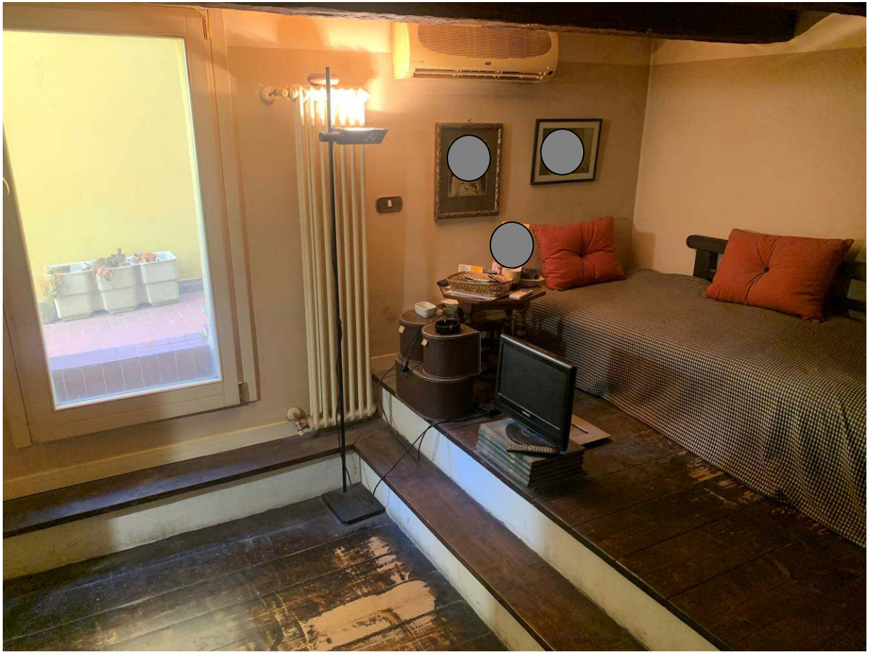
9. Camera nel soppalco