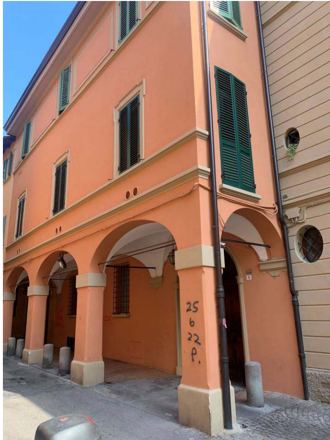
1. Vista fabbricato esterno