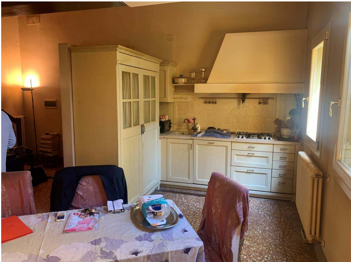
4. Cucina pranzo