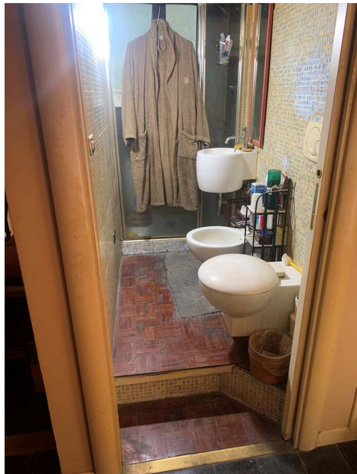
10. Bagno nel soppalco