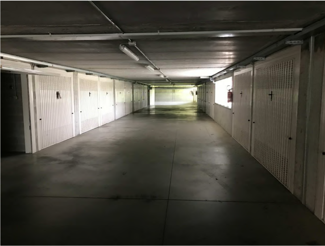
Il corsello comune