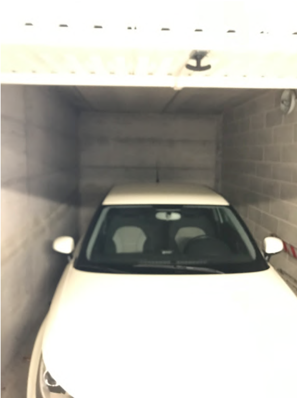
Garage sub 34