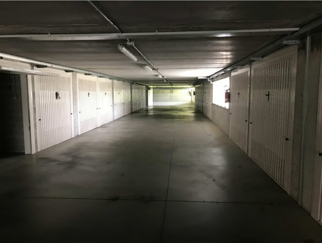
Il corsello comune