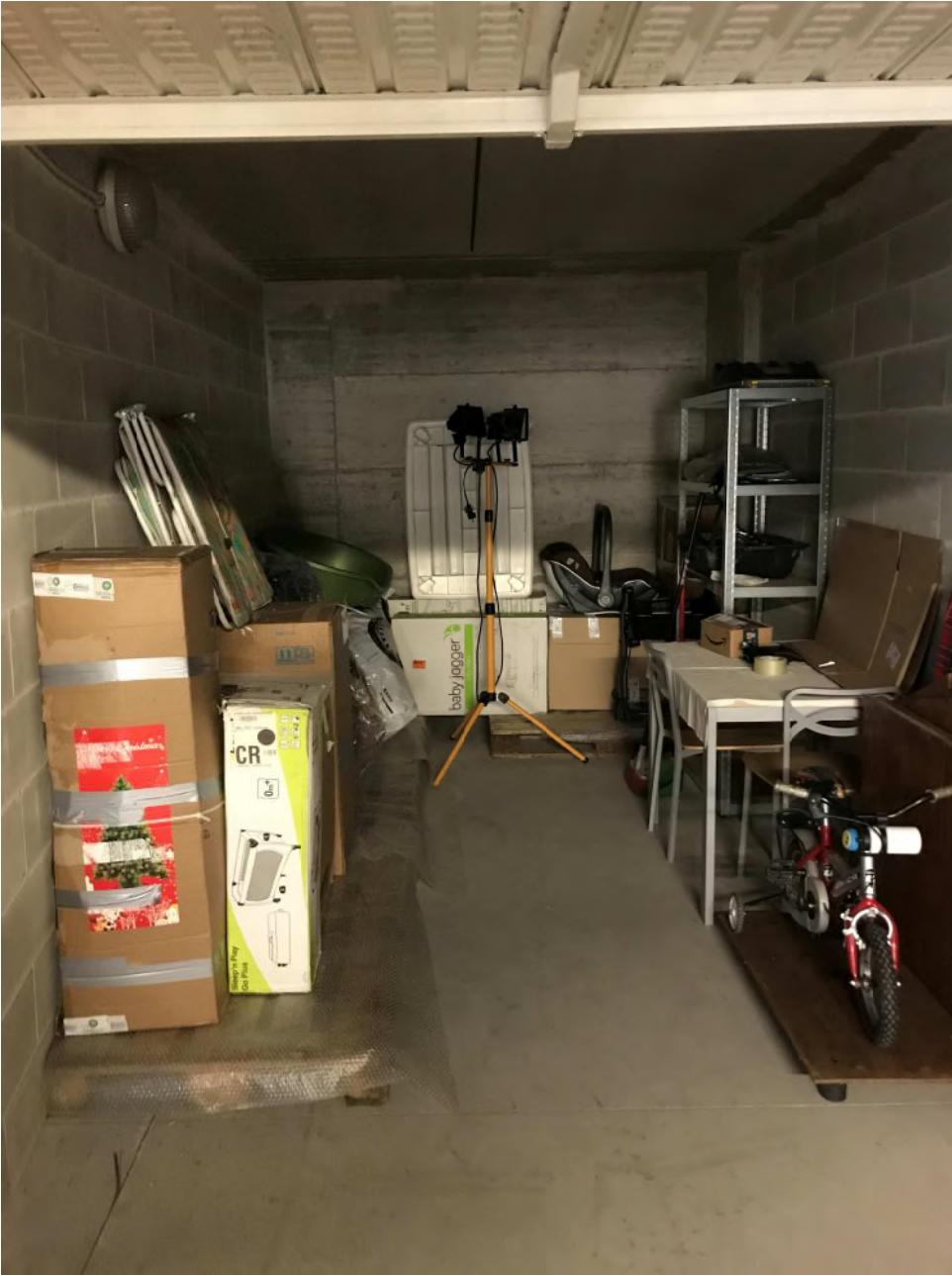
Garage sub 41