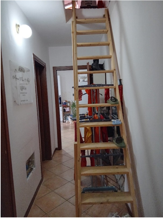
Scala accesso sottotetto