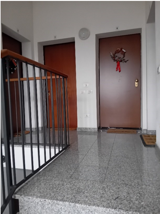
Pianerottolo piano secondo