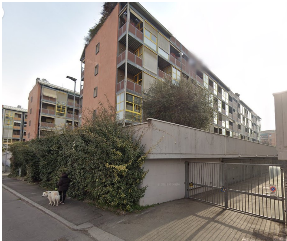
1. Vista del fabbricato