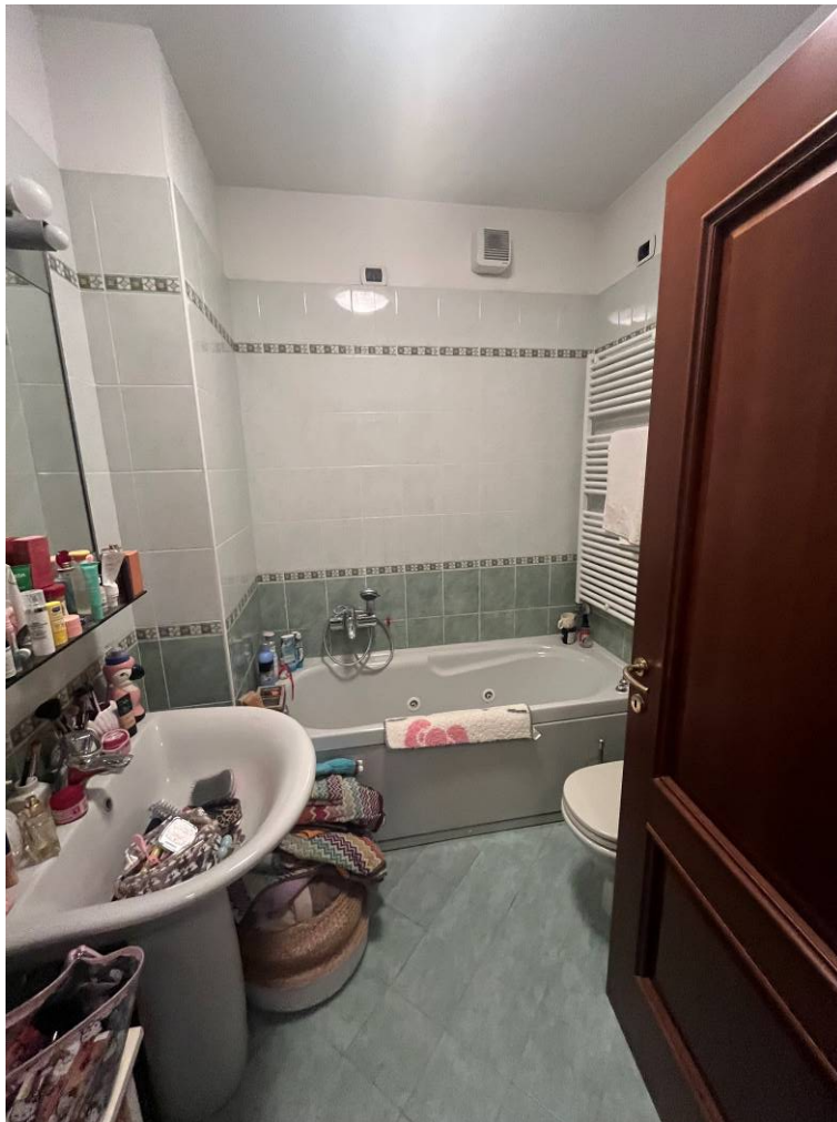
7. Bagno zona notte