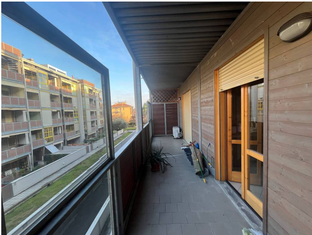
8. Terrazza a Nord