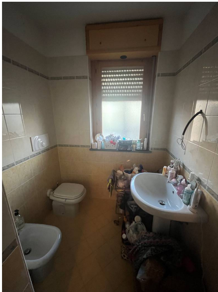
6. Bagno zona giorno