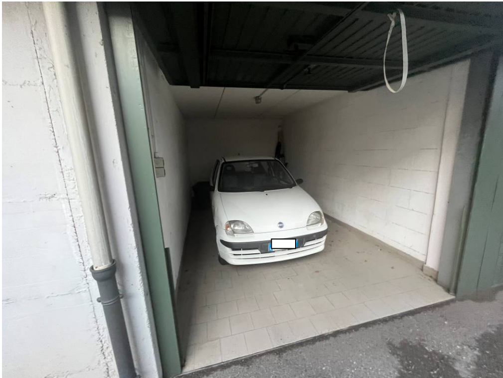
10. Autorimessa al piano interrato