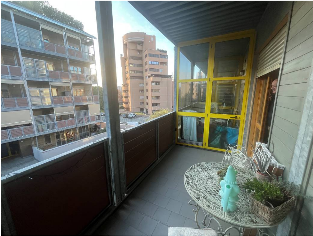
9. Terrazza a Sud con serre