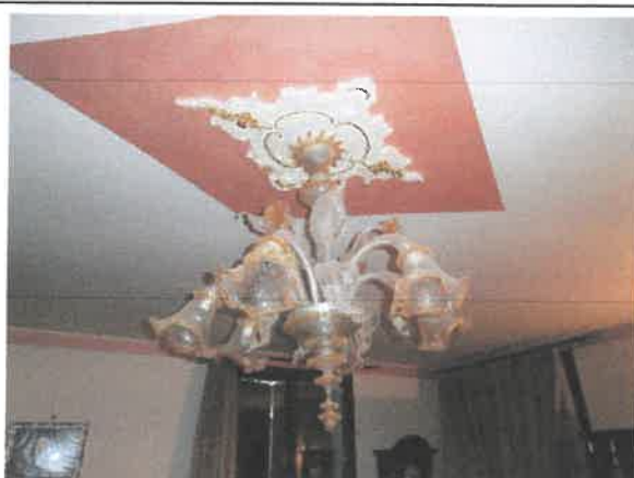
Foto 4, lampadario in vetro a 6 luci, prog. 007