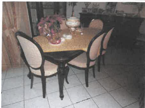
Foto 1, tavolo e sedie in legno, prog. 001 e 002