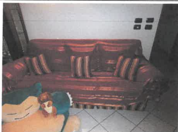
Foto 5, divano in tessuto, prog. 010