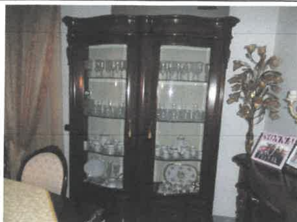
Foto 2, vetrinetta in stile, prog. 004