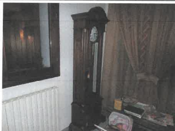
Foto 3, orologio a pendolo, prog. 006