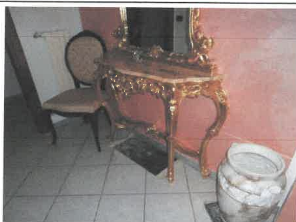
Foto 6, consolle da ingresso, prog. 012